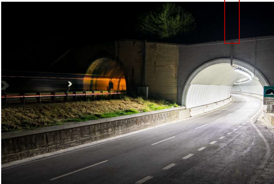
PRIMA e DOPO la ristrutturazione